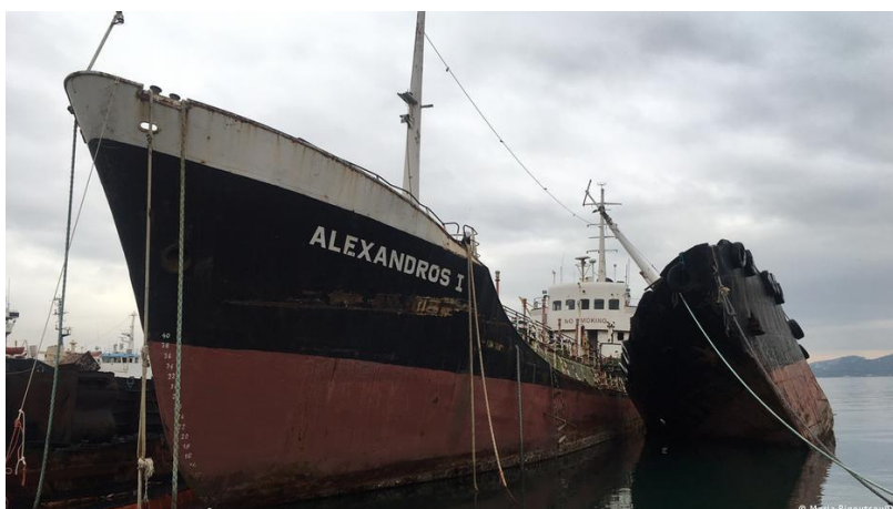
Mysterien von heute- der Schiffsfriedhof von Elefsina

Die Auseinandersetzung erfolgt dabei im Dialog zum antiken Erbe und zeigt, wo sich die Geschichte des modernen Griechenlands manifestiert und wie die Finanzkrise und der jüngst einsetzende Immobilienboom die Metropole prägt.